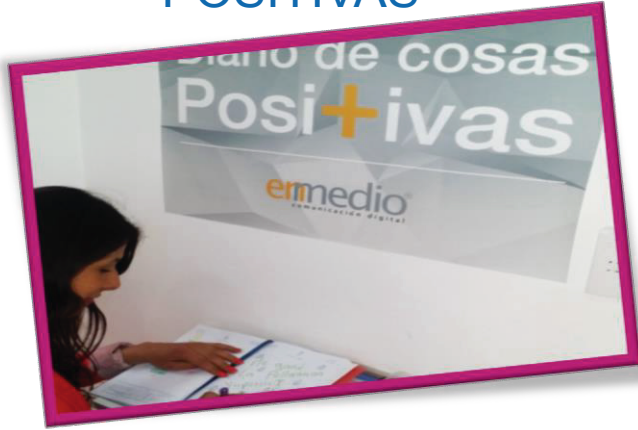
DIARIO DE COSAS POSITIVAS